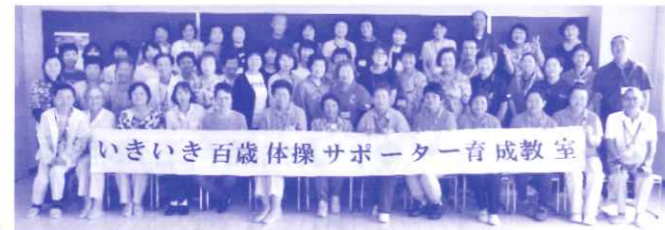
いきいき百歳体操サポーター育成教室