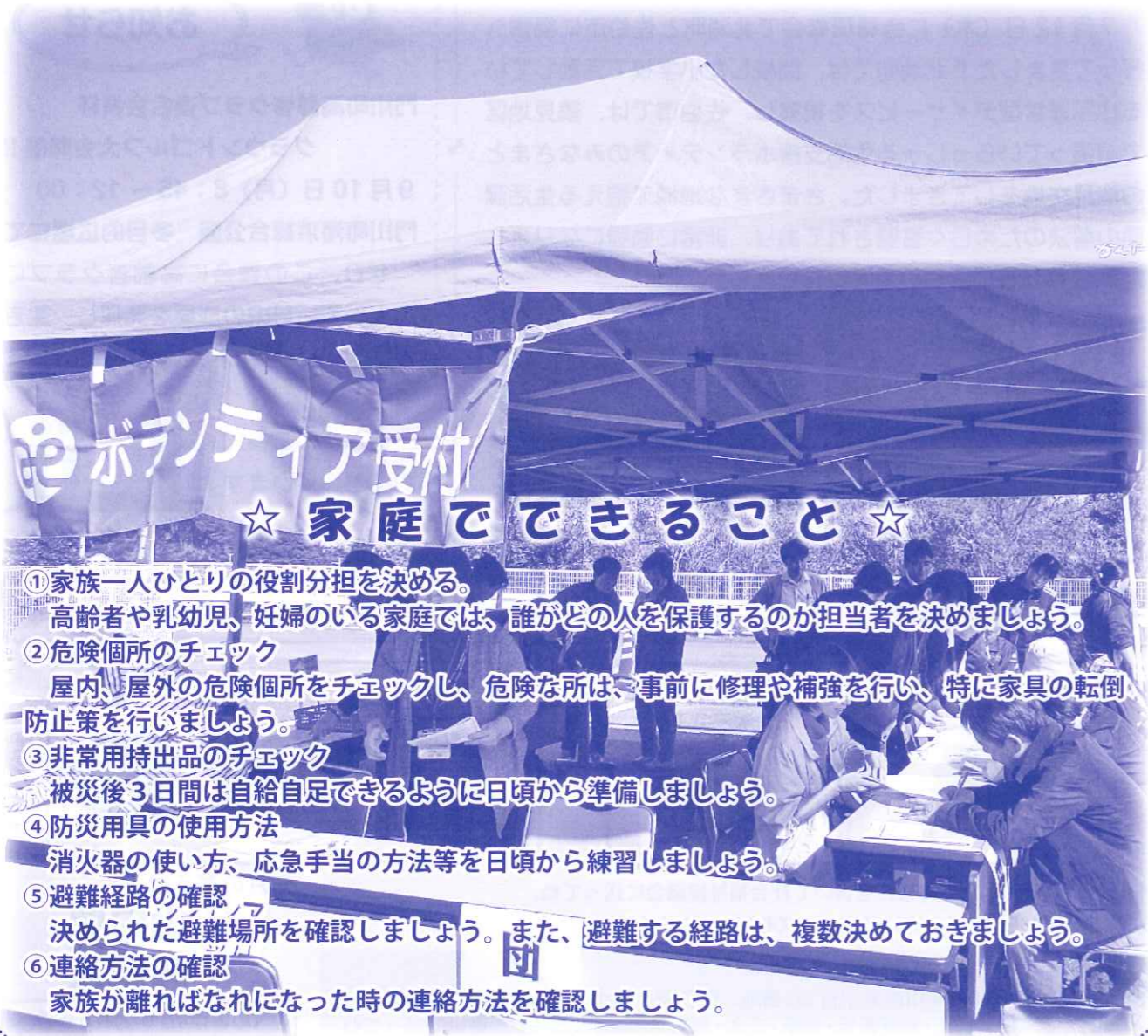
昨年の災害ボランティア運営研修会の一コマ

日頃から、いつ起こるか分からない災害に備えて、 『家庭でできること』『地域でできること』を 確認しましょう。