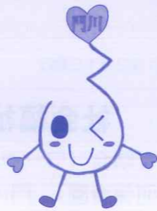
門川町社協イメージキャラクター『ふくしデンパくん』