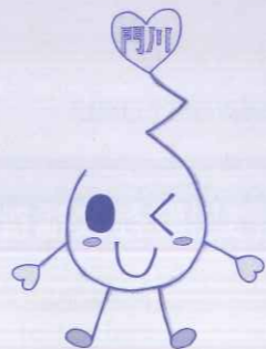
門川町社協イメージキャラクター 「ふくしデンパくん」