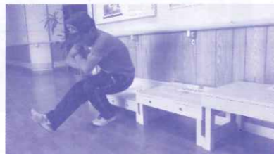
片足測定 立ち上がり途中