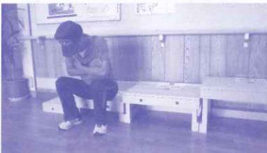
両足測定 開始前→立ち上がり途中

台の高さは40cm、30cm、20cm、10cmの4種類あり、両足または片足で立ち上がり測定をします。両足測定の場合、足は肩幅に広げ、両腕は組んだ状態で反動をつけずに立ち上がります。